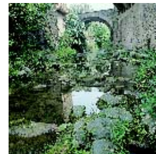
El pont sobre el riu Brugent.