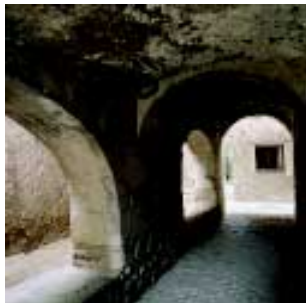
Porxada i cementiri vell.

També desaparegut, donava accés a la Sagrera des de l'antic camí de les Planes i seria la porta més vella del recinte.