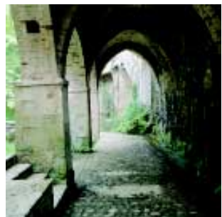
Porxada sobre el torrent de l'Ombert.

Són elements configuradors del paisatge urbà de Sant Feliu que fan possible la contemplació d'un conjunt equilibrat d'aigua i de vegetació de tornada cap al Firal.