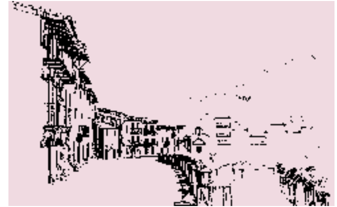
Cases del carrer de Sant Sebastià amb la capella del sant al centre.