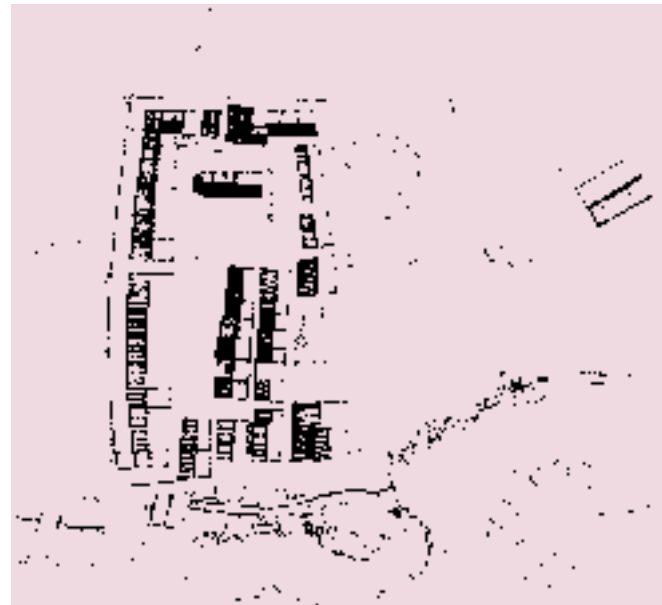
La Cellera -ampliació de la Sagrera- emmurallada, del segle XIV.