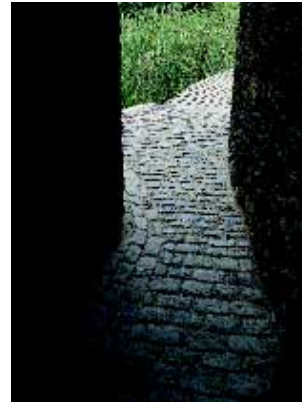
Baixada a la resclosa del Molí de la Conqueta des del Firal.

Castells d'Hostoles, de Colltort i de Puig Alder; Santuari de la Mare de Déu de la Salut; esglésies de Sant Miquel de Pineda i de Sant Iscle de Colltort; volcans de Sant Marc, del Puig Roig, de Fontpobra, de la Tuta, de Can Tià i del Traiter; colades basàltiques al riu Brugent.