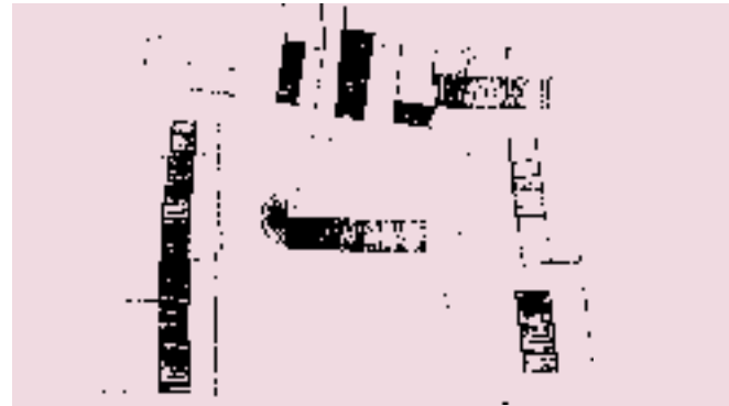
Les cases de la Sagrera i l'església romànica del segle XIII.

Inicialment Carrer o Vico Maiori , lloc de convocatòria de la Universitat de la Vall, té els seus orígens al s. XIV. L'església actual, construïda entre els segles XVI i XVII, va substituir l'anterior nau romànica destruïda pels terratrèmols de 1427.