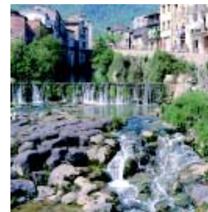
La resclosa del Molí Gros.