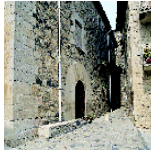
Entrada a la Sagrera pel portal de Migjorn.

L'actual carrer dels Valls conserva l'estructura de l'antic carreró que separava les cases de la muralla i els seus valls.