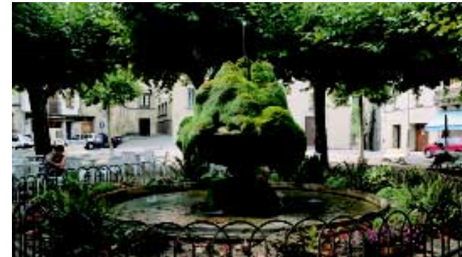
La font del Firal, antiga plaça Verda, del segle XV.

És una de les obres hidràuliques transformada i perfeccionada progressivament des de les primeres rescloses i estacats de fusta de l'antic Molí d'Aiguabella existent abans del s. XIV.