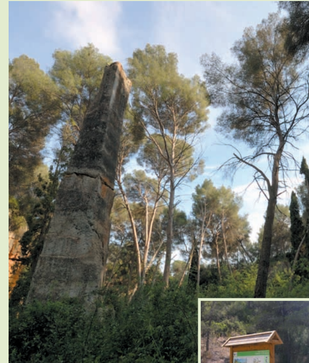
Sot del Mèdol