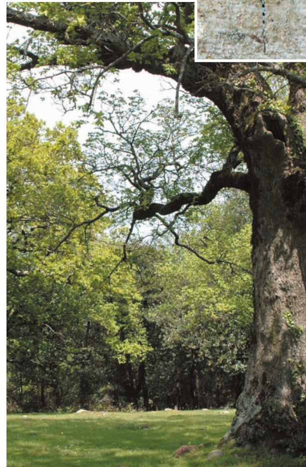
Aurons de l'Albera

Aquí s'hi inclouen tant els boscos dominats per espècies forestals, que a Catalunya rarament formen boscos, com ara teixos, grèvols, aurons, etc., com els boscos en els quals hi viuen altres espècies de flora i/o fauna protegides, atès que part d'aquestes espècies són insectes o ocells que viuen en boscos i que estan amenaçats o que són rars.